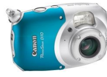
Canon Powershot D10